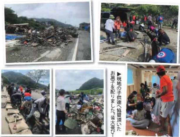
▶現地の子供達へ検査頂いたお菓子配りました。皆大喜び！

7月の被災直後からFacebookで物資と現地活動出来る球磨川災害復旧ボランティア参加の呼び掛けを開始、現地活動は9月6日で7回目を迎え、延べ388名の方々に協力頂けました。 災害直後から未だ熊本県は新型コロナウイルスの件で県外ボランティアの受け入れを拒否していますが、事前の現地調査で分かったのは断然「人手不足」である事。同志達が安全なルート・駐車場の確保、全て自己責任の上万全な注意を払い私が責任者として、被害が